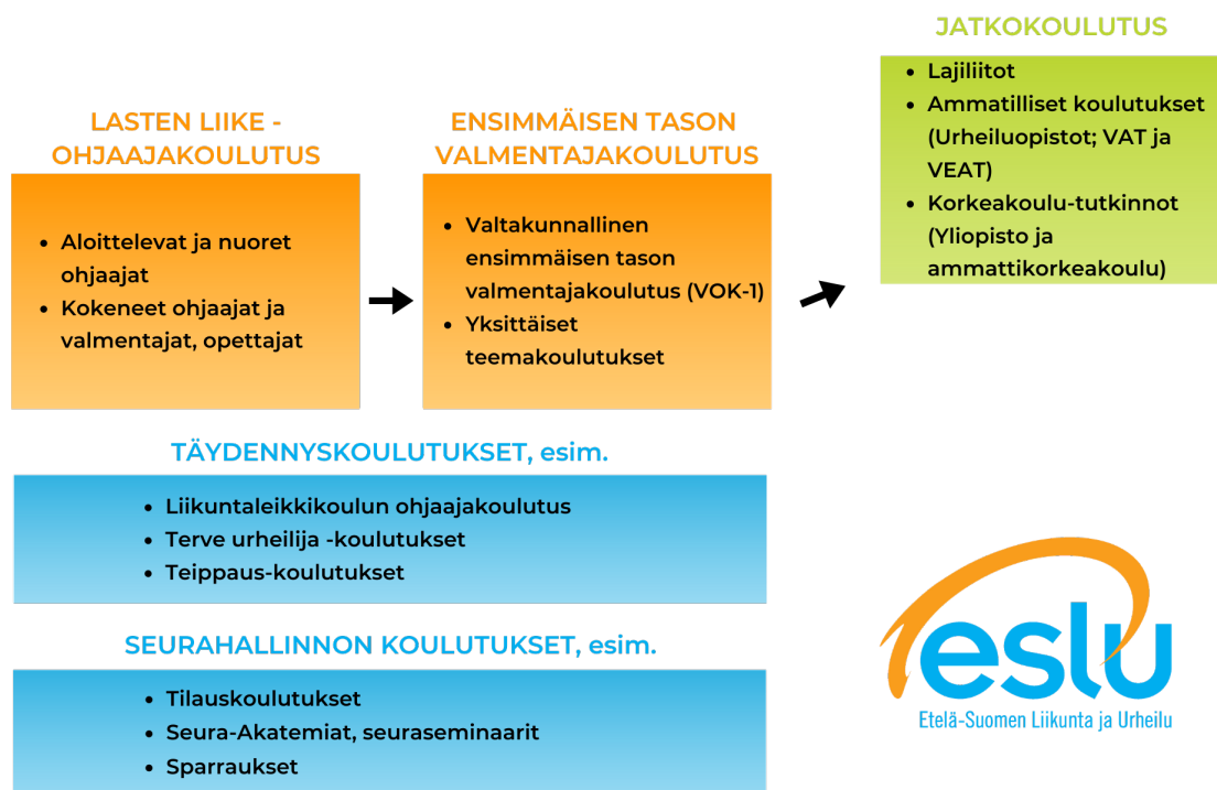
Kuva: ESLUn ohjaajan ja valmentajan polun malli