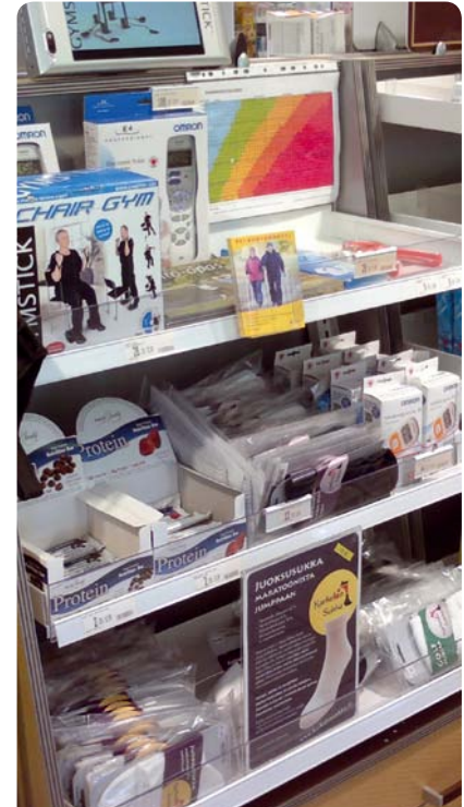
Liikuntahylly kuuluu Liikkujan Apteekin lisätasoon I.

KKI-ohjelman painonhallinta- ja terveystuotteet ovat apteekkeille maksuttomia. Lisätietoja materiaaleista ja niiden tilaamisesta saat osoitteesta www.kki.likes.fi → Materiaalit.